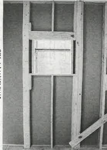
壁パネルは住宅会社や工務店に好評だ

一方、CADの生産性向上にも力を入れている。現在、CAD要員は実務担当が50人のうち、16名に削減された。また、CAD要員は実務担当が50人のうち、16名に削減された。また、CAD要員は実務担当が50人のうち、16名に削減された。