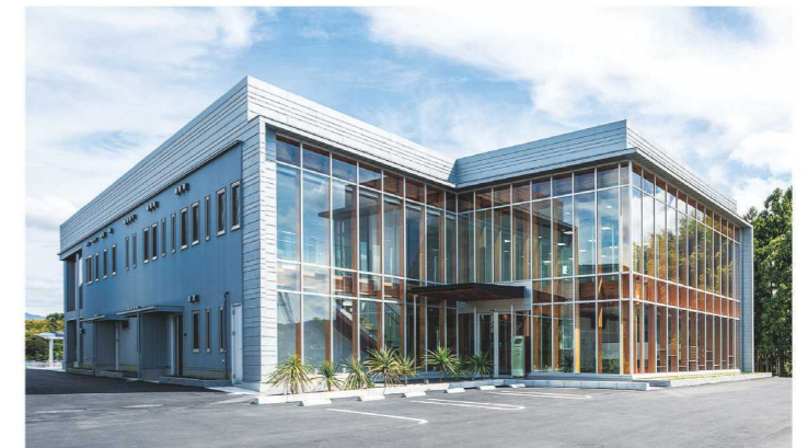
▲ 上から下まで全面ガラス張りの新社屋。外観としても「見える」会社を実現

私から言うのもなんですが、本当に働きやすい環境がここにはあると思っています。「住」ということに少しでも興味があれば、ナカザワの扉をたたいてみてください。